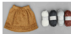
Netgarn Banegårdsgade 10