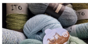
Tøndering Strik Graven 3