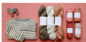
Strikkepinden - og den lille Zebra Jærgårdsgade 42