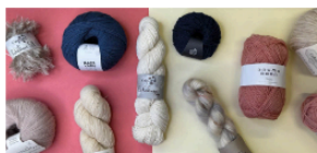
City Stoffer & Garn Park Allé 9