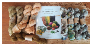
Garnlageret Rosenkrantzgade 31