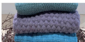
PaulaGarn Tordenskjoldsgade 12